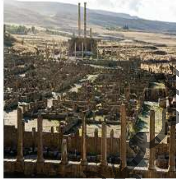
صورة مسرح تيمقاد في العهد الروماني