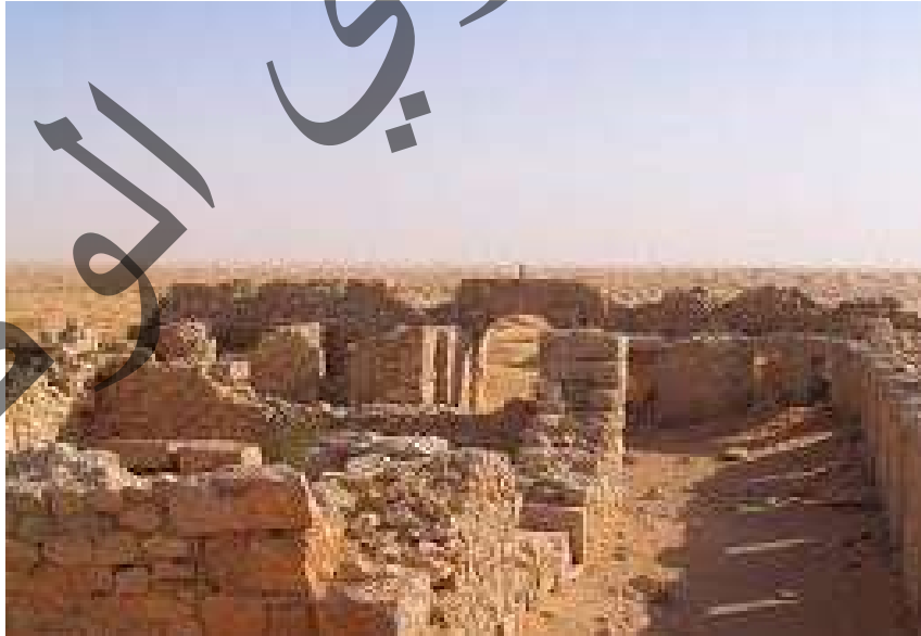
صورة لأحد الحصون البيزنطيين