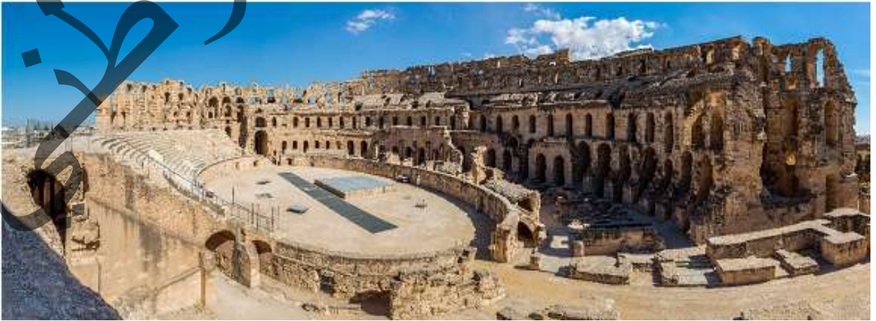
صورة مسرح قرطاج